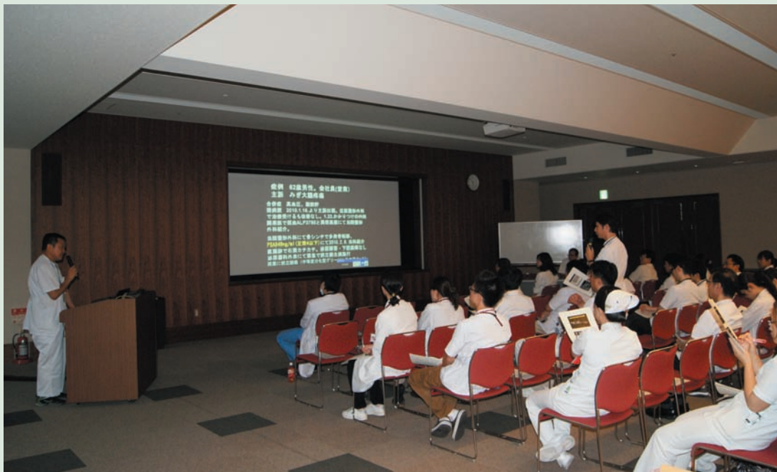
第2回がん診療ボード風景（8月8日実施）