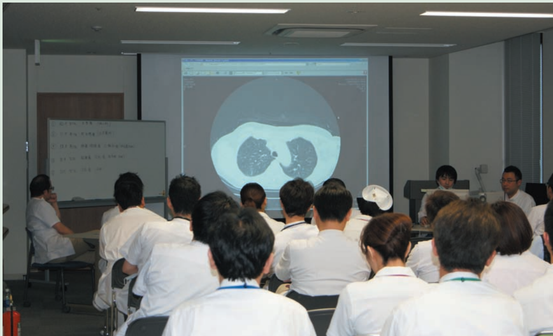
第1回がん診療ボード風景（6月16日実施）

点病院に指定されました。今後も、近隣の医療施設と連携させて頂き、地域医療に貢献したいと考えています。患者・家族が満足して頂ける様に努めていく所存です。諸先生方のご指導ご鞭撻を賜りますよう、何卒よろしくお願い申し上げます。